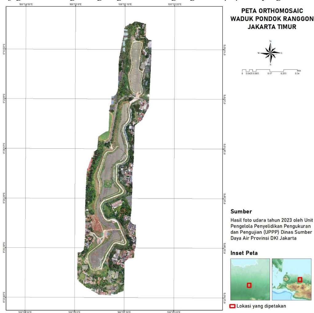
Gambar 3. Hasil Orthomosaic Foto Udara

Keberadaan Waduk Pondok Ranggon memiliki manfaat yang beragam. Pertama, waduk ini berfungsi sebagai penampungan air hujan yang dapat digunakan untuk memenuhi kebutuhan air sehari-hari penduduk sekitar. Selain itu, waduk ini juga berperan penting dalam pengendalian banjir di wilayah sekitarnya. Dengan menampung air hujan secara terkontrol, waduk ini dapat mencegah banjir yang dapat merendam pemukiman dan infrastruktur di sekitarnya. Selain itu, Waduk Pondok Ranggon juga memberikan manfaat ekologis. Wilayah sekitar waduk merupakan habitat bagi berbagai jenis flora dan fauna. Lingkungan sekitar waduk, termasuk hutan, tumbuhan air, dan ekosistem perairan, memberikan tempat tinggal dan sumber makanan bagi beragam spesies. Oleh karena itu, perlindungan dan pelestarian ekosistem di sekitar waduk sangat penting untuk menjaga keseimbangan lingkungan dan kelangsungan hidup spesies yang ada.