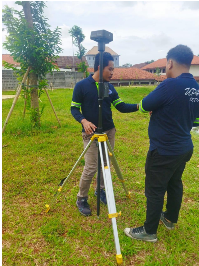
Gambar 2. GPS RTK ( Real-Time Kinematic )