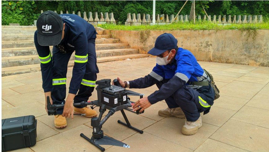
Gambar 1. Drone DJI- Zenmuse L1 LiDAR