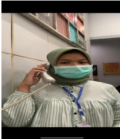
Gambar 3. kegiatan layanan operasional

Berdasarkan pengamatan yang dilakukan selama melakukan layanan operasional dimana masalah nasabah adalah kurangnya pemahaman nasabah dalam penggunaan aplikasi BRImo, namun dengan adanya layanan operasional ini yang memberikan penjelasan tata cara penggunaan aplikasi BRImo sehingga dapat menarik nasabah untuk menggunakan aplikasi BRImo. Dapat dikatakan bahwa layanan operasional ini banyak membuat nasabah tertarik untuk menggunakan aplikasi BRImo.