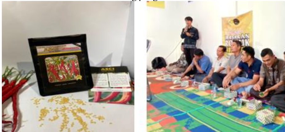
Gambar 2. Kemasan benih Cabe dan Kegiatan Pelatihan Pemasaran Online