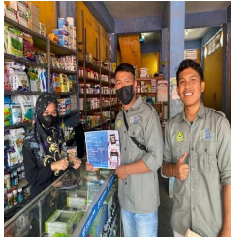
Gambar 2. Pengisian gerai produk cabe di toko pertanian

Hasil pelatihan ini juga berupa adanya produk usaha BUMDes berupa benih cabe yang berlabel ASCI, Dimana dengan hasil desain yang menarik benih cabe ASCI ini telah dipasarkan secara konvensional melalui gerai toko pertanian di kawasan kecamatan Gunung Kerinci.