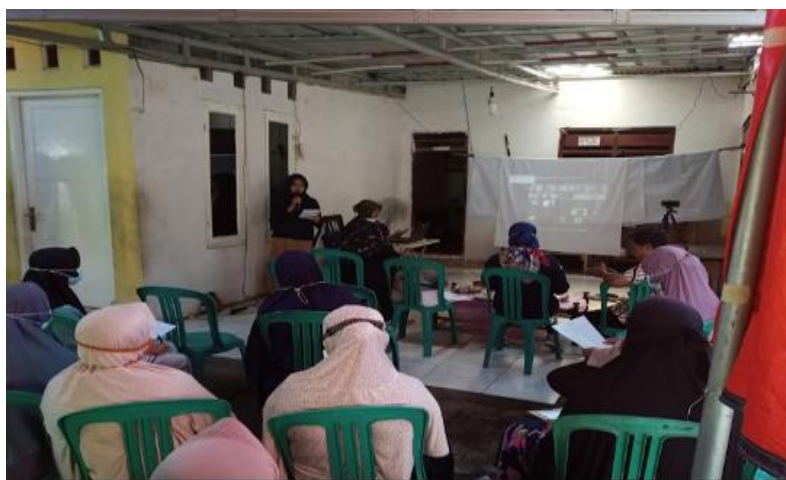
Gambar 1. MC membuka Kegiatan

Pelaksanaan pengabdian masyarakat bersama mitra LPM Rempoa disambut hangat oleh seluruh peserta kegiatan, yakni para ibu pemilik usaha kecil di Rempoa. Materi yang dibawakan pun mudah dimengerti dan diharapkan mampu meningkatkan pengetahuan mereka dalam mengelola keuangan usaha kecilnya. Peserta sangat merasakan manfaat dari kegiatan ini dimana mereka akan membuat laporan keuangan yang unuk mengetahui laba rugi usahanya. Kedepannya kegiatan ini diharapkan dapat berlangsung secara berkesinambungan dan dapat memberikan materi-materi yang update dan bermanfaat bagi LPM Rempoa.