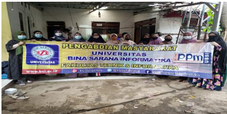
Gambar 5. Foto Bersama setelah Acara

Pada gambar 4, tutor secara online sedang memberikan penjelasan tentang mengelola keuangan usaha kecil dengan menggunakan aplikasi kepada peserta Pengabdian Masyarakat.