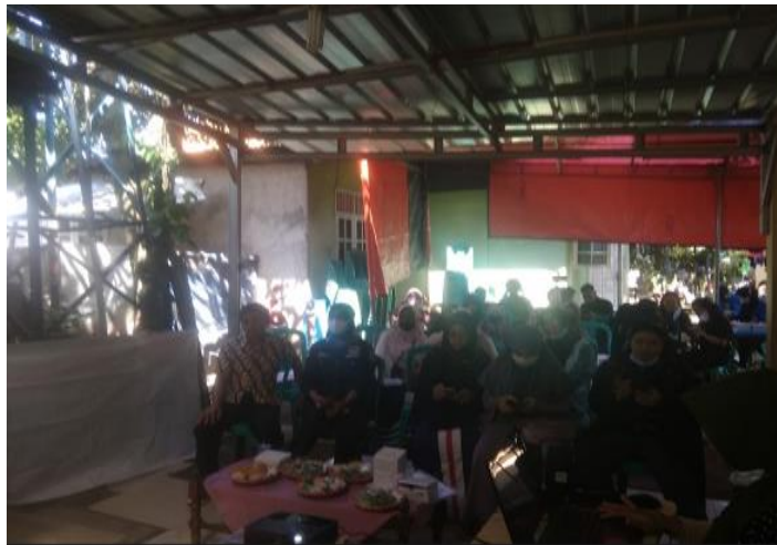
Gambar 2. Para Dosen dan LPM Rempoa

Pada gambar 2, Dosen dan unsur LPM serta peserta mengikuti acara Pengabdian Masyarakat dengan antusias.