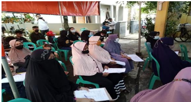
Gambar 3. Peserta Kegiatan

Pada gambar 2, Dosen dan unsur LPM serta peserta mengikuti acara Pengabdian Masyarakat dengan antusias.