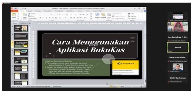
Gambar 4. Penyampaian Materi

Pada gambar 3, peserta sedang mengikuti acara Pengabdian Masyarakat.