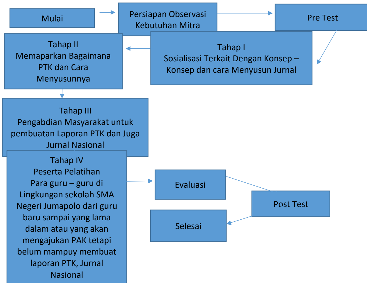
Gambar 2. Metode Yang Digunakan

Pada Guru – guru di SMA negeri Jumapolo, Karanganyar, Jawa Tengah. Guru belum mampu dalam pembuatan laporan PTK dan berbentuk jurnal nasional: