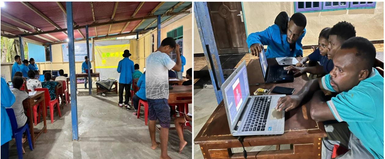
Gambar 2. Kegiatan Pelatihan Desain Grafis

Beberapa faktor yang mendukung terlaksananya kegiatan Pelatihan Desain Grafis Dengan Pemanfaatan Software Photoshop Sebagai Peluang Usaha ini adalah besarnya minat dan antusiasme peserta selama kegiatan, sehingga kegiatan berlangsung dengan lancar dan efektif. Sedangkan faktor penghambatnya adalah keterbatasan waktu pelatihan serta keterbatasan perangkat komputer yang dimiliki oleh warga kampung bremi untuk mengulang materi yang diberikan pada saat pelatihan berlangsung (Dewi and Verina 2021).