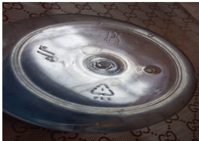
Gambar 3. Kemasan Plastik Kode 1 PET Tampilan Bening

Kemasan plastik warna bening kode 1 PET dapat dilihat pada gambar 3.2.3