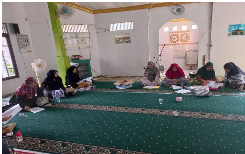
Gambar 6. Penyampaian Materi

Dokumentasi untuk kegiatan pengabdian kepada masyarakat ini dapat dilihat pada gambar 3.3.1 sampai dengan 3.3.4 berikut ini. Dokumentasi penyampaian materi dapat dilihat pada gambar