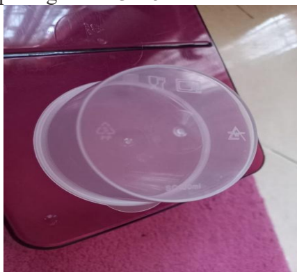
Gambar 5. Kemasan Makanan Kode 5 PP

Gambar 3.2.4 merupakan gambar botol minuman yang terbuat dari jenis plastik kode 5 PP. Jenis plastik kode 5 PP dikenal sebagai jenis plastik yang paling aman untuk wadah minuman. Botol minuman ini bisa digunakan untuk menyimpan berbagai jenis minuman seperti air mineral, teh, madu dan sirup serta bagus sekali untuk botol minum bayi. Botol minuman dengan kode 5 PP juga lebih kuat bahannya namun tetap ringan dan daya tembus uap untuk jenis plastik ini dinilai rendah serta memiliki ketahanan yang baik terhadap lemak. Kemasan ini juga boleh digunakan berulang kali sebagai wadah makanan dan minuman. Kemasan plastik untuk makanan dengan kode 5 PP dapat dilihat pada gambar 3.2.5.