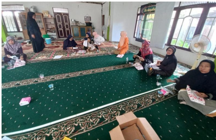
Gambar 7. Para Peserta Mengajukan Pertanyaan

Selanjutnya dokumentasi para peserta saat mengajukan pertanyaan dapat dilihat pada gambar berikut