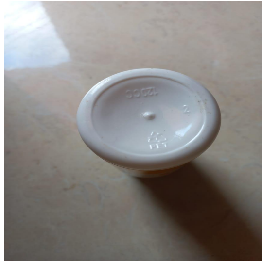
Gambar 2. Kemasan Plastik Kode 1 PET Berwarna Putih