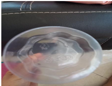
Gambar 4. Kemasan Minuman Kode 5 PP

memudahkan melihat isinya dan menjadi pemandangan tersendiri yang bervariasi jika disajikan dengan wadah penyimpanan (toples) lainnya dengan beragam isi jenis makanan atau snack. Wadah penyimpanan (toples) dengan jenis plastik kode 1 PET ini sangat cocok digunakan untuk menyimpan bahan makanan atau snack karena jenis plastik nya mampu menghalangi keluar masuknya air, oksigen dan karbondioksida. Perlu diingat juga bahwa jenis kemasan dengan kode 1 PET ini hanya boleh untuk sekali pakai. Hal ini berarti bahwa jika makanan telah habis dikonsumsi maka kemasannya tidak boleh lagi digunakan untuk menyimpan makanan minuman lainnya. Namun masih bisa dimanfaatkan untuk menyimpan benda-benda lainnya selain makanan. Kemasan plastik untuk minuman dengan kode 5 PP dapat dilihat pada gambar 3.2.4.